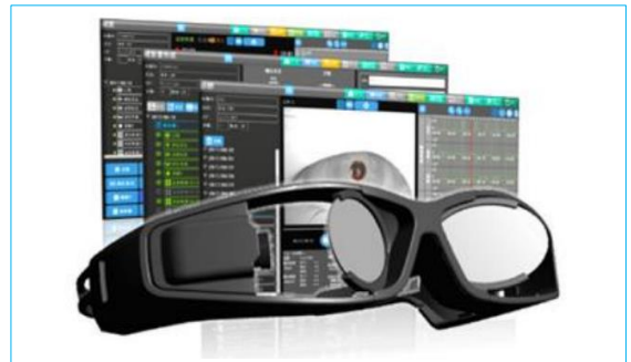
眼球運動検査装置ワイボーググラス ※第一医科HPより

大賞の他、株式会社JMC、フヨー株式会社と大阪大学が提携して開発した、冠動脈や不整脈治療、心筋生検、経カテーテル大動脈弁留置術を学べる「心臓カテーテル手技訓練用モデル群」が医工連携イノベーション賞を受賞。課題解決チャレンジ賞には、株式会社ケー・シー・シー商会の「採血静注練習キット(看護師一人一台、復職練習用)」が受賞しました。