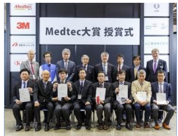
Medtec 大賞 授賞式